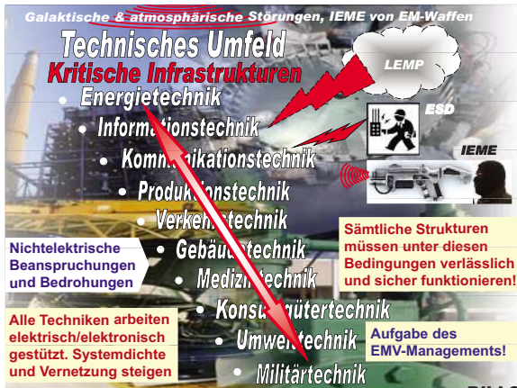
Bild 2: Elektromagnetisches Bedrohungsszenario des technischen Umfeldes. Kurzbezeichnungen siehe [2]

sungen. In Krisenzeiten ist des Weiteren verstärkt mit Bedrohungen durch energieintensive elektromagnetische Phänomene (IEME) durch kriegsbedingt oder terroristisch eingesetzte elektromagnetische Waffensysteme zu rechnen (Mikrowellenwaffen, EM-Weapons, e-Bombs, HERF-Guns u.ä. [2]). Besonderes Augenmerk gilt in diesem Zusammenhang den kritischen Infrastrukturen [4], d.h. den stark IT-abhängigen lebenswichtigen Organisationen, Einrichtungen sowie Dienstleistungs- und Versorgungsbereichen wie Transport- und Verkehrswesen, Energie, Gefahrstoffe, Informationstechnik und Telekommunikation, Finanz-, Geld- und Versicherungswesen, Versorgung mit lebenswichtigen Gütern sowie Behörden, Verwaltung und Justiz von deren Funktion Staat, Wirtschaft und öffentliches Leben in entscheidendem Maße abhängen.